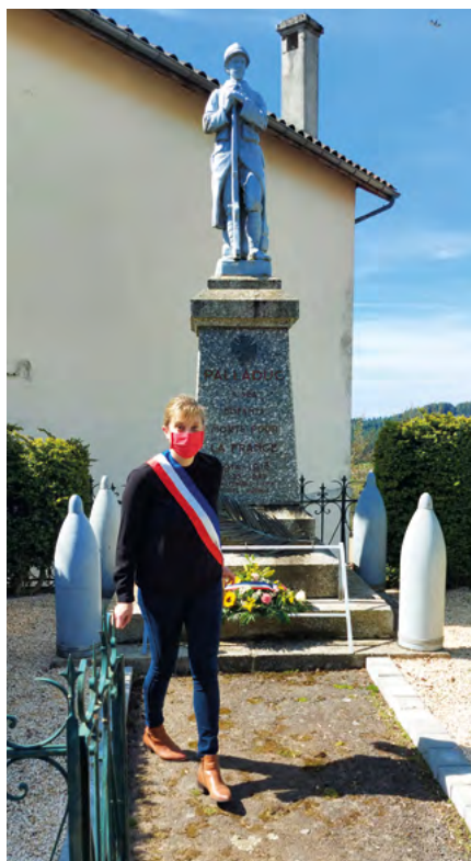
Le 8 mai