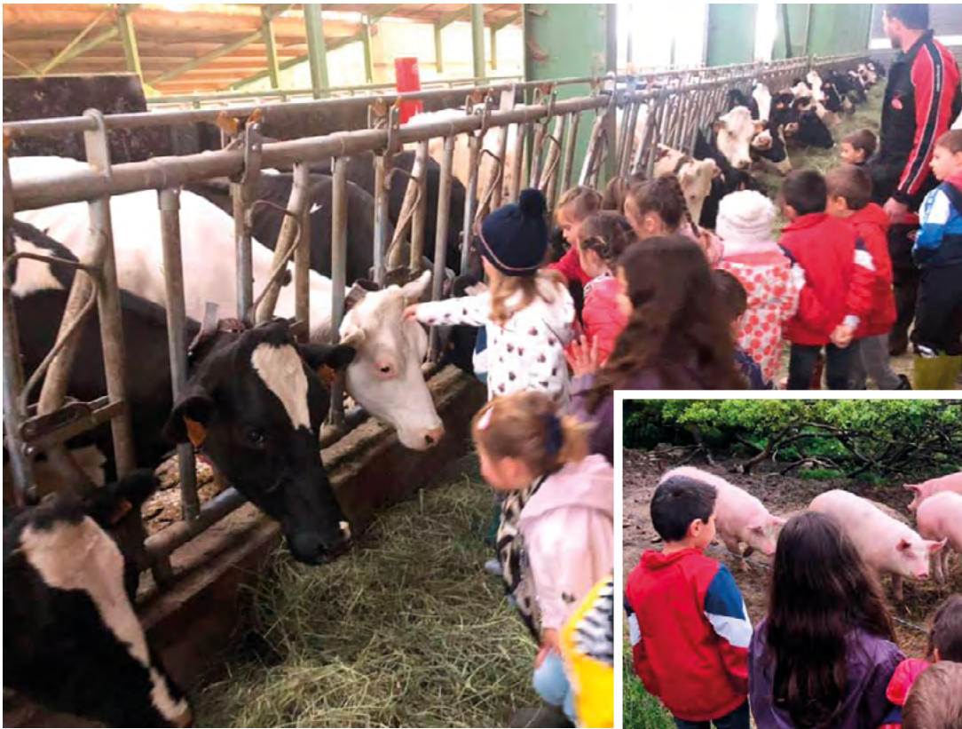
Visite des maternelles le 21 mai à la Ferme des Bessières.