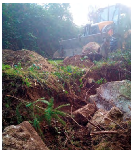
Le chemin du Vieux Palladuc a eu besoin d'un lifting... Tout comme celui de Redevis.