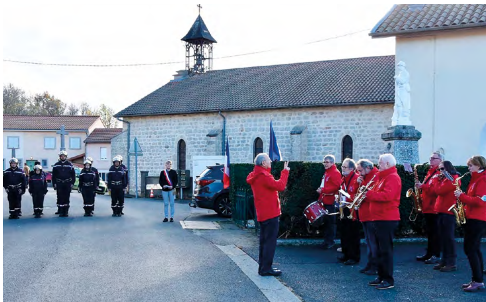
Le 11 novembre