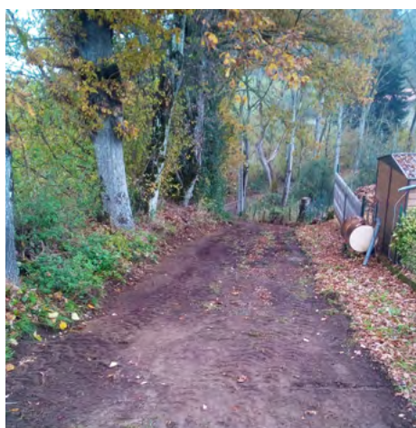
Ouverture chemin du Mas.