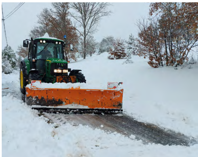
Entretien de voiries et chemins y compris le déneigement ainsi que les rues du bourg.

Intervention sur le réseau d'eau, recherches de fuite, réparations. Cette année, une fuite importante à Forest a nécessité de nombreuses heures de travail et de patience. D'autres interventions de ce type ont été effectuées sur la commune.