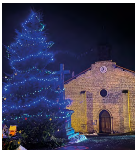
L'installation des sapins et illuminations que nous devons à nos agents avec quelques fois les aléas climatiques.