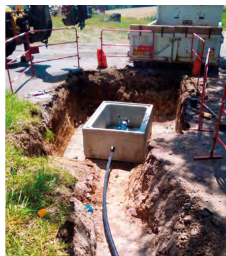
Pose de compteur de section aux Fougères.